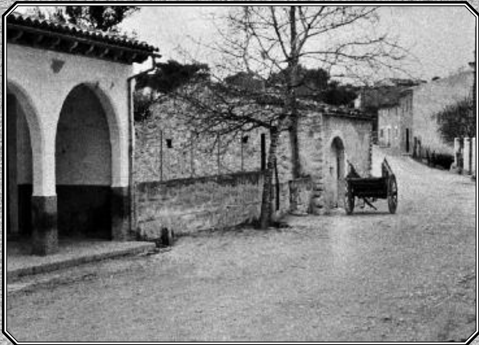
Moscari. Imatge d'ahir - imatge d'avui