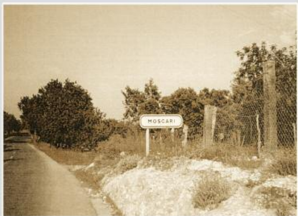
Moscari. Entrada, imatge d'ahir - imatge d'avui