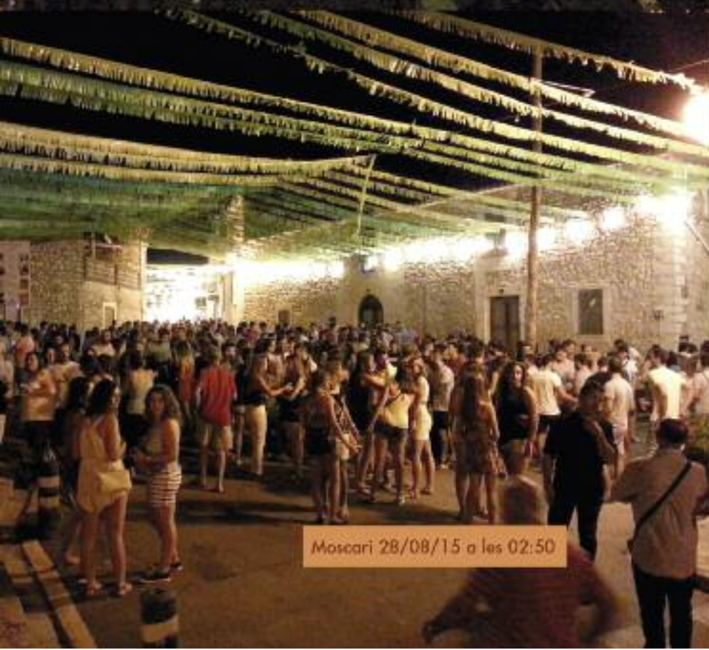
Moscari 28/08/15 a les 02:50