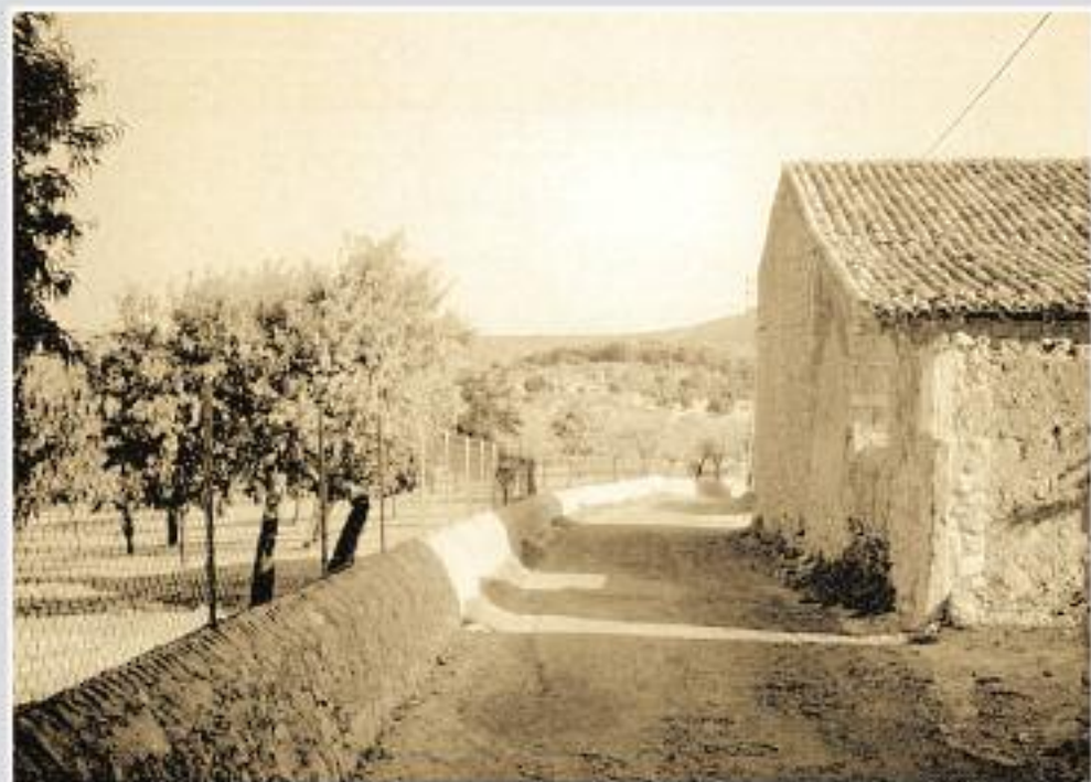
Moscarí. Carrer Passeig de Sa Creu, imatge d'ahir - imatge d'avui